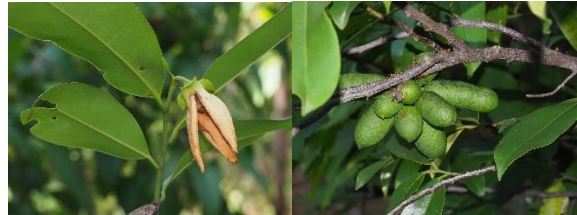
Uvariacordata (Dunal) Alston