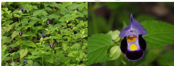
Toreniafournieri Linden ex E. Fourn.