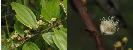
Rhodamniadumetorum (DC.) Merr. & L. M. Perry