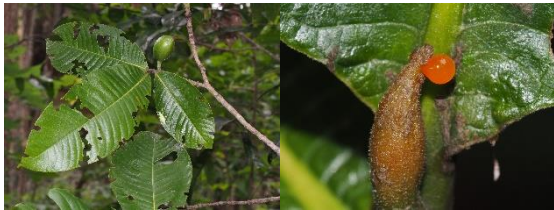
Gardenia sootepensis Hutch.