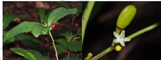
Erythroxylumcuneatum (Miq.) Kurz