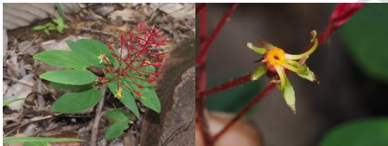
Lasiobemapanicilliloba (Gagnep.) A. Schmitz