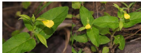
Toreniaflava Buch.-Ham. ex Benth.