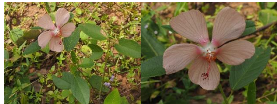
Decaschistiacrotonifolia Wight & Arn.