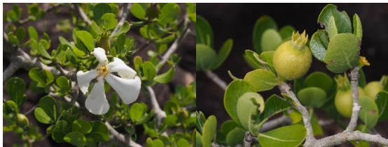
Gardenia saxatilis Geddes