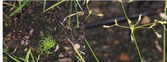
Fimbristylis insignis Thwaites