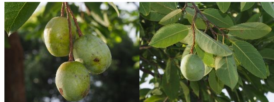
rvingiamalayana Oliv. ex A. W. Benn.