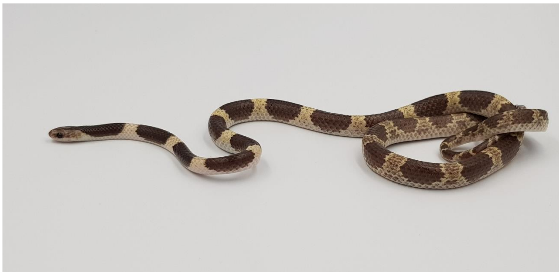
ภาพที่ 16 งูปล้องฉนวน ( Lycodon sp.)