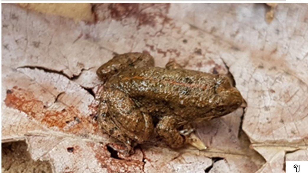
ภาพที่ 5 เขียดหลังปุ่มที่ราบ ( Occidozyga martensii )