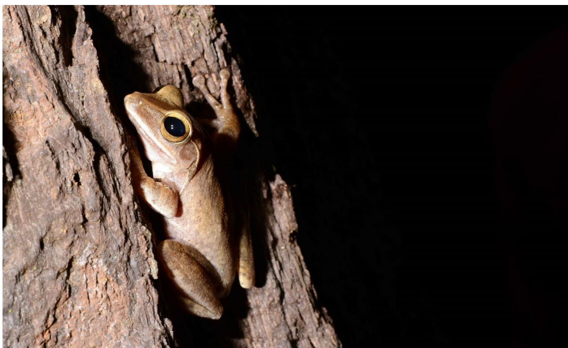
ภาพที่ 10 ปาดบ้าน ( Polypedates leucomystax )

กลางวันซุกซ่อนตัวอยู่ในกองใบไม้ ใต้ขอนไม้ หรือฝังตัวลงในดินชั้นๆ โคนต้นไม้ ในซอกพุ่มพอน ในตอนกลางคืน เกาะอยู่ในพุ่มไม้เตี้ยๆ ในฤดูฝนออกมาเกาะเถาวัลย์ และกิ่งไม้เล็กๆ ใต้เรือนยอดตลอดทั้งวัน เวลาฝนตกจะมารวมกลุ่มกันรอบแอ่งน้ำฝนซัง พร้อมส่งเสียงร้อง วางไข่เฉพาะในแอ่งน้ำฝนซังบนพื้นป่า ขณะรวมกลุ่มกันเพื่อวางไข่ ตัวเมียจะมาชุมนุมกันรอบๆ แอ่งน้ำ ส่วนตัวผู้เกาะอยู่บนต้นไม้ หรือพุ่มไม้รอบบริเวณ เวลาวางไข่ทั้งสองเพศจะก่อกองสีขาวขึ้นมาริมแอ่งน้ำ ภายในกองมีไข่สีขาวขุ่นจำนวนมาก ลูกอ๊อดฟักออกจากกลุ่มฟอง แล้วออกมาเติบโตในแหล่งน้ำต่อไป