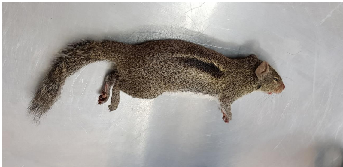
ภาพที่ 17. กระรอกดินข้างลาย ( Menetes berdmorei ) กำลังสลบเพื่อรอการเจาะเลือดก่อนถูกปล่อยคืนสู่ธรรมชาติ