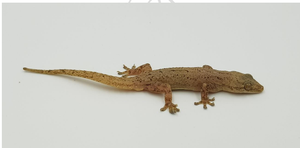
ภาพที่ 14 จิ้งจกบ้านทางหนาม ( Hemidactylus frenatus )