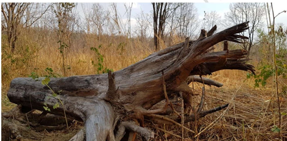
ภาพที่ 12 ขอนและรากไม้สำหรับการหลบซ่อนของจิ้งจกและตุ๊กแก