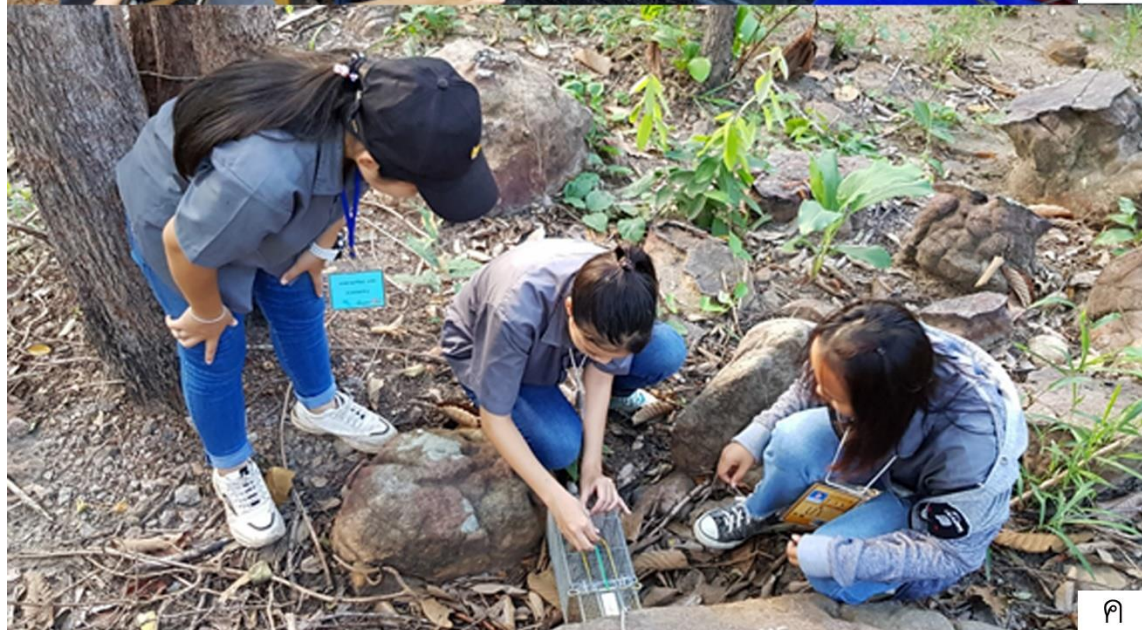
ภาพที่ 3 คณะผู้วิจัยและนักศึกษาจากสาขาชีววิทยา คณะวิทยาศาสตร์ มหาวิทยาลัยขอนแก่น ร่วมกันสำรวจสัตว์สะเทินน้ำสะเทินบก สัตว์เลื้อยคลาน และสัตว์เลี้ยวถูกด้วยนมในพื้นที่ปกปักษ์พันธุ์กรมพืช