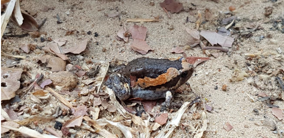
ภาพที่ 7 อึ่งอ่างบ้าน ( Kaloula pulchra )