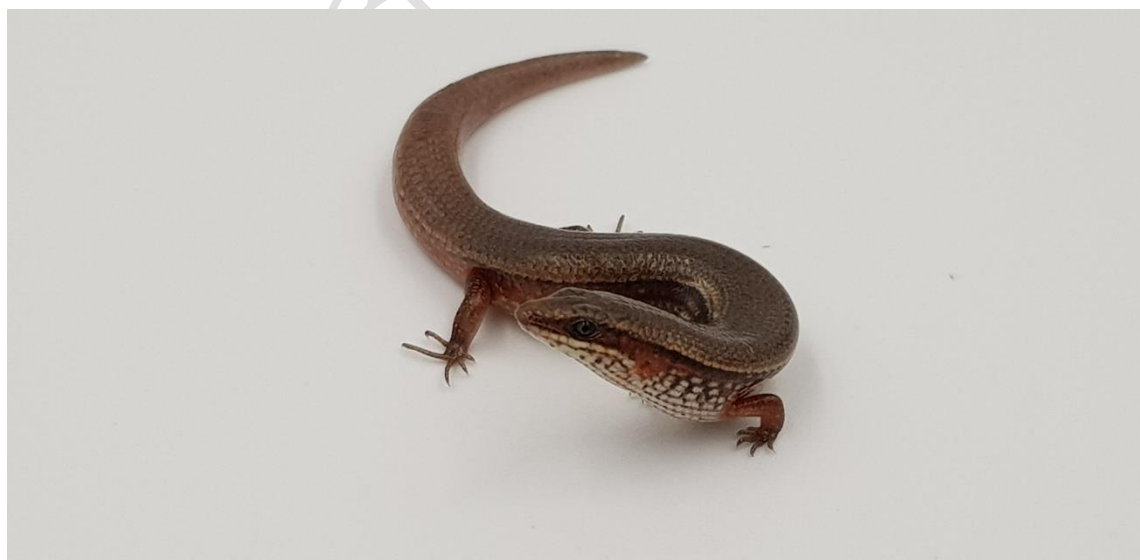
ภาพที่ 15 จิ้งเหลนเรียวยาวท้องเหลือง ( Riopa bowringii )

ไม่ถูกจัดเป็นสัตว์ป่าคุ้มครองตาม พ.ร.บ. สงวนและคุ้มครองสัตว์ป่า พ.ศ. 2535