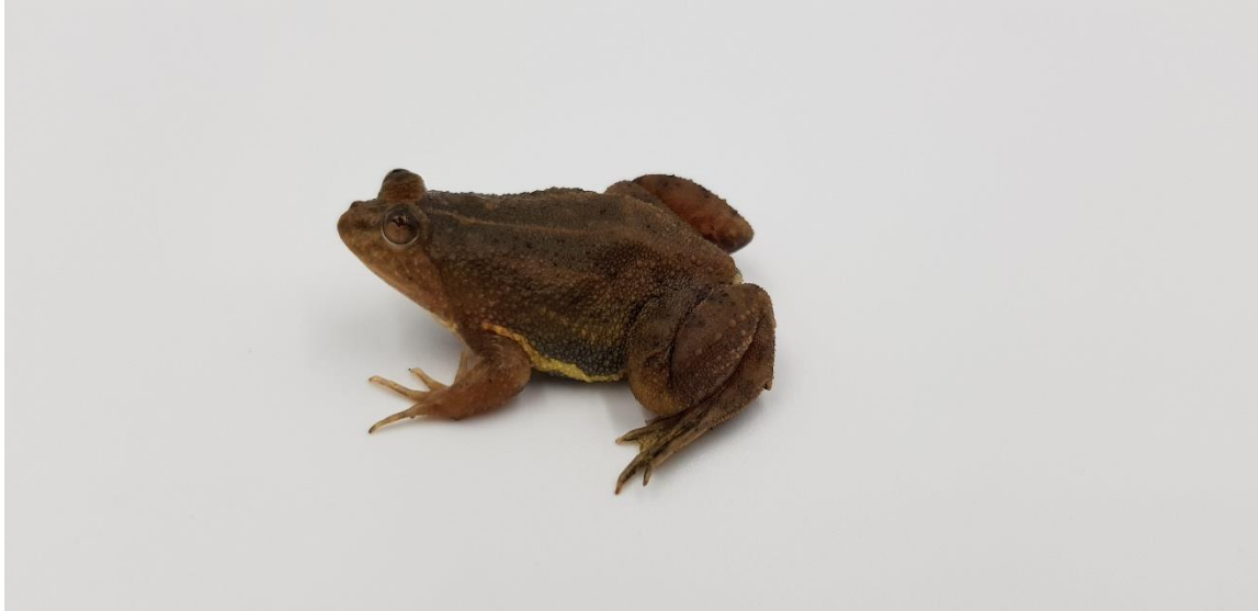
ภาพที่ 6 เขียดจะนา ( Occidozyga lima )