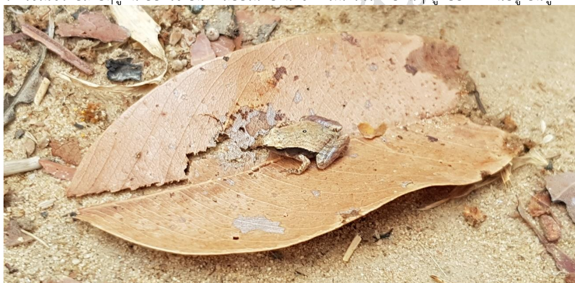
ภาพที่ 9 อึ่งข้างดำ ( Microhyla heymonsi )

ซุกซ่อนตัวอยู่ใต้ใบไม้แห้ง กองหิน กองหญ้า และวัสดุอื่นๆ บนพื้นดิน มักอยู่ไม่ไกลจากแหล่งขยายพันธุ์ ซึ่งเป็นแอ่งน้ำขัง มีความว่องไวในการซุกซ่อนตัวใต้ใบไม้แห้ง และกระโดดหนีได้ไกล เวลาตกลงสู่พื้นดินจะรีบพลิกตัวหลบเข้าใต้ใบไม้ หรือวัสดุอื่นๆ ทันที ไม่นอนหมอบนิ่งอยู่กับที่ดังเช่นอึ่งชนิดอื่นๆ วางไข่ในช่วงปลายฤดูฝน ออกไข่เป็นแพลงตอนในแอ่งน้ำขัง ที่มีน้ำในระดับตื้นๆ ลูกอ๊อดหากินอยู่เป็นฝูง